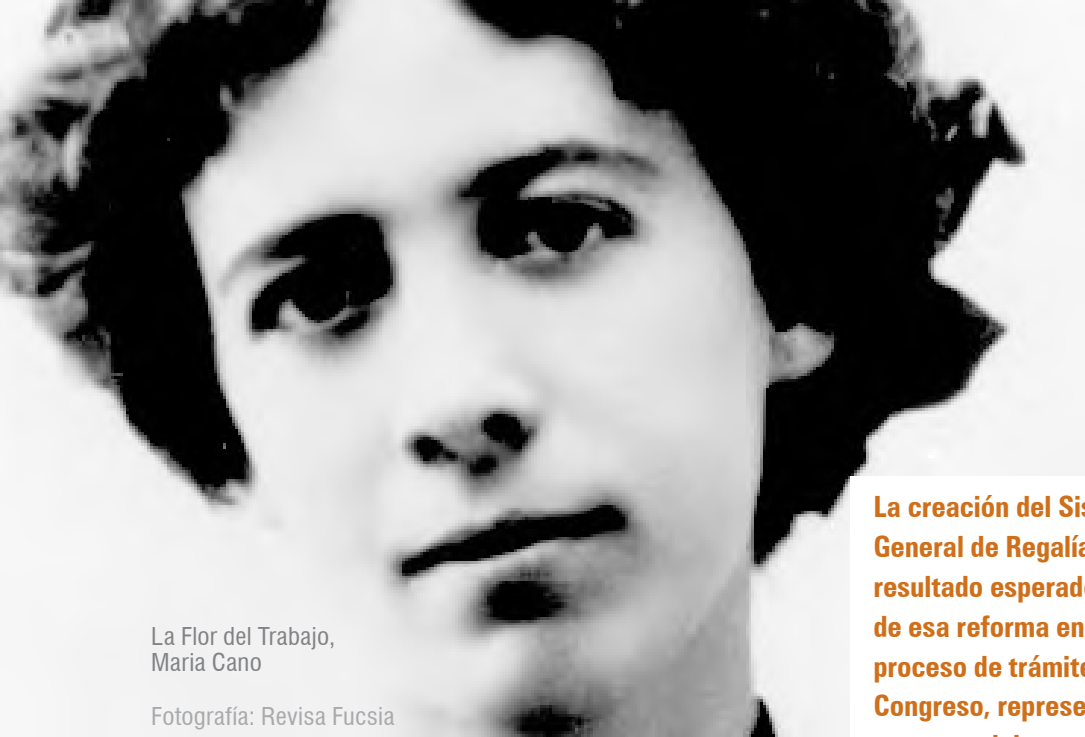
La Flor del Trabajo, Maria Cano