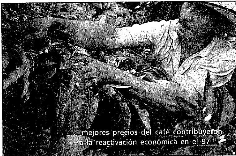
mejores precios del café contribuyeron a la reactivación económica en el '97

◆ La gran mayoría de los negocios de 1997, antes que promover la competencia y la eficiencia, como lo enseña la ideología neoliberal, propició, más bien, la concentración de la riqueza y del capital en los principales grupos económicos (Santodomingo, Ardila Lülle, Sarmiento Angulo, Sindica-