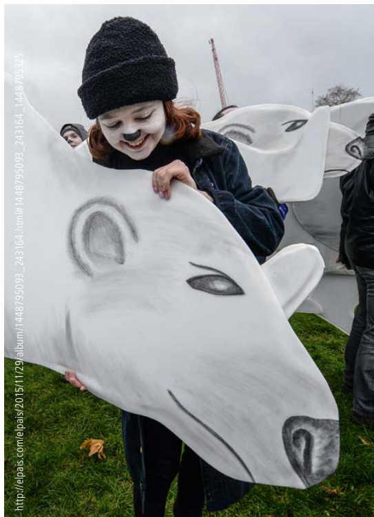
Londres, Reino Unido

Ello explica, por ejemplo, por qué los acuerdos sobre una “reforma rural integral” son reinterpretados, no sólo para inscribirlos dentro de la lógica del modelo de empresarización capitalista del campo, sino para afianzar el existente régimen de concentración de la propiedad sobre la tierra e, incluso, demandar la revisión de regulaciones preexistentes en la legislación colombiana. Señala el Consejo: “Instrumentos como la expropiación por motivos de interés social o de utilidad pública, y la extinción administrativa del dominio por incumplimiento de la función social y ecológica de la propiedad, si bien preexisten en la legislación colombiana, deberán ser revisados y reglamentados en su aplicación, en un marco de garantía del debido proceso y la legítima defensa de los propietarios legales de la tierra”. La apelación a la legítima defensa es cuando menos preocupante, cuando se contemplan los escenarios del posacuerdo. No sobra preguntarse si por “legítima defensa” se comprende la