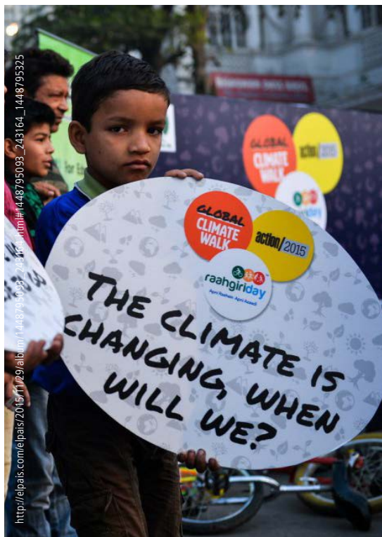
Nueva Delhi, India